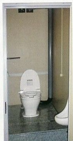
洋式タイプは、より清潔にご使用いただけるよう、小便器を別に設けています。